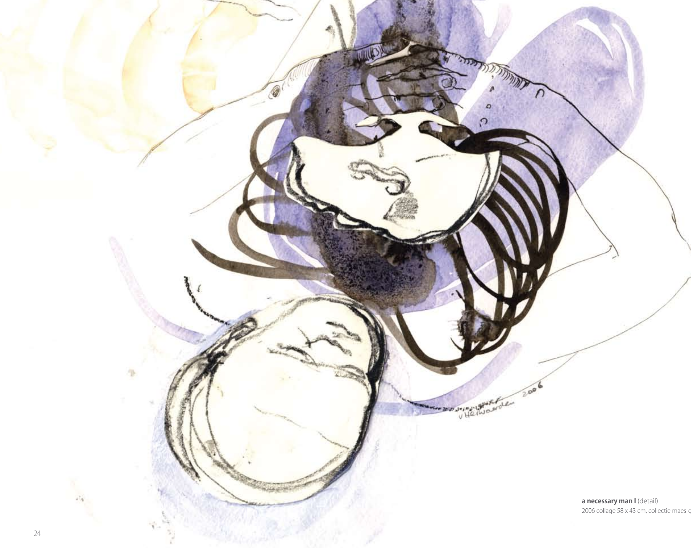
a necessary man I (detail) 2006 collage 58 x 43 cm, collectie maes-gerwe, amsterdam