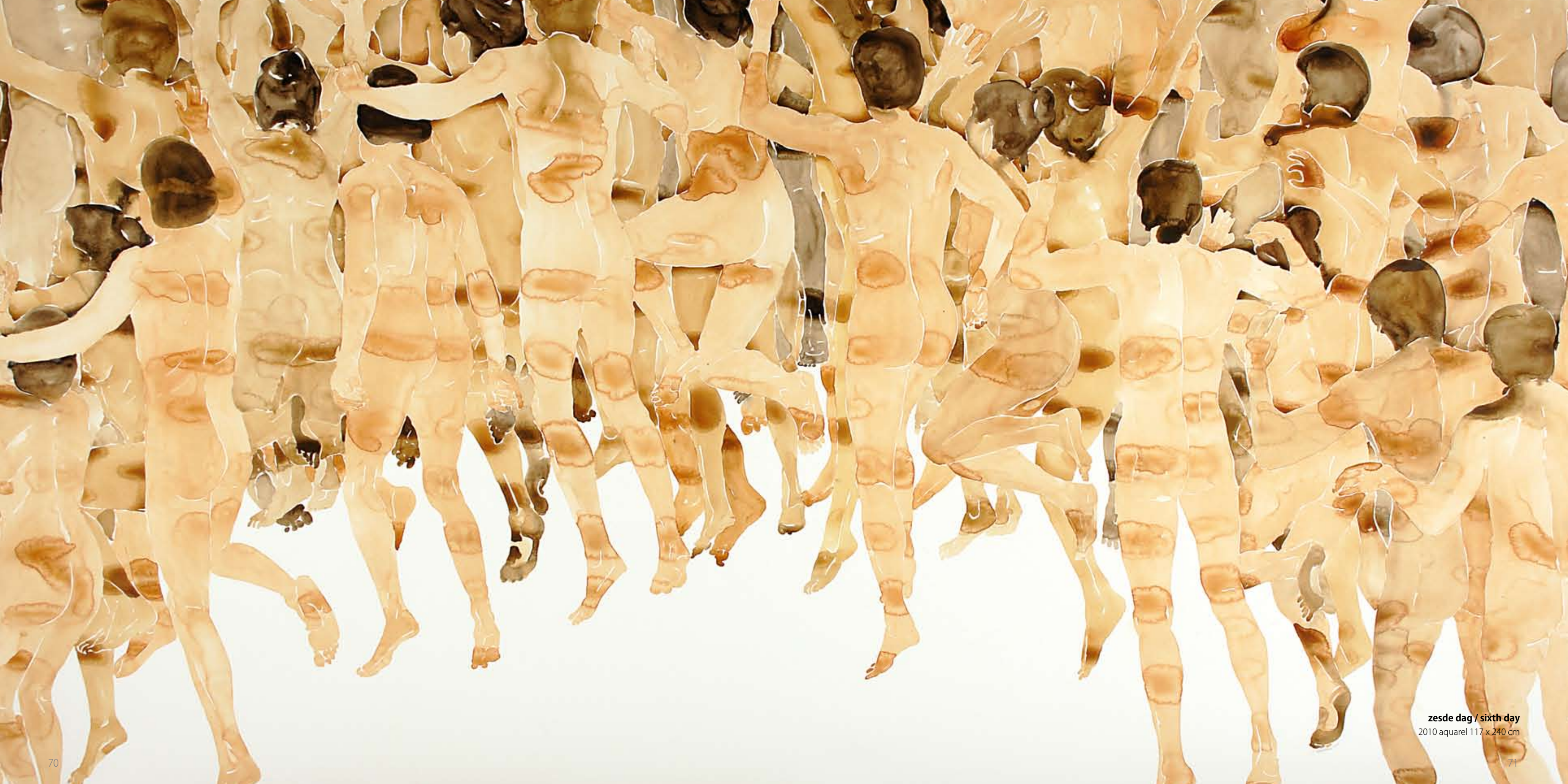
zesde dag / sixth day 2010 aquarel 117 x 240 cm