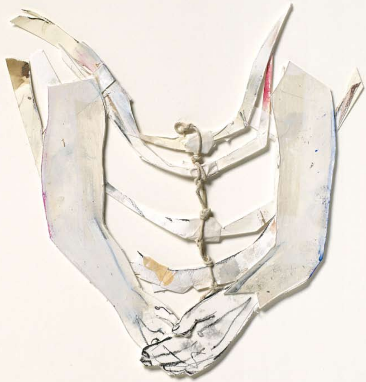
ribbeeld I / a rib's image I 2010 losse collage met touw 50 x 40 cm