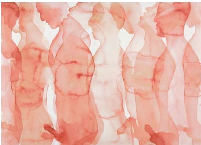
man wacht wel / man bides time

2003 aquarel 22 x 35 cm privé-collectie, amsterdam